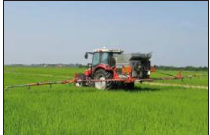
[ Damax D 1700 R.

fanno salti di gioia, però trapela un cauto ottimismo. La situazione viene definita tendenzialmente di attesa, di riflessione. Da un lato ci sono i soliti Psr che possono dare la spinta, dall'altro in alcune zone d'Italia ci sono difficoltà per le piogge abbondanti nel periodo autunno-invernale. L'augurio dei costruttori è ovviamente che i clienti non aspettino le sovvenzioni per fare un investimento, ma al momento rimangono solo i grandi clienti a potersi permettere una logica imprenditoriale a tutto tondo nella propria azienda agricola, con conseguente impatto anche sul parco macchine in dotazione. ■