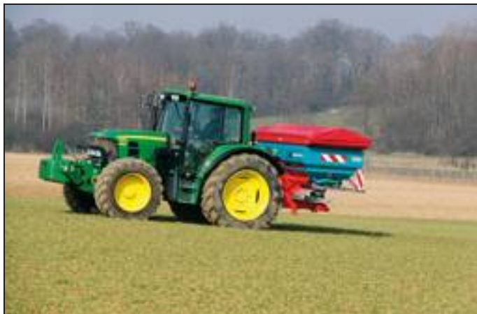
[ Sulky X36 DBP.