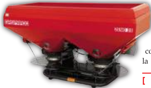
[ Gaspardo Zeno 28.

Chiudiamo con un commento sull'inizio della stagione 2013. Non si