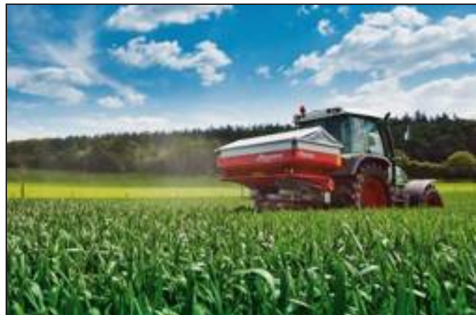
[ Kverneland Exacta CL-EW.

max, Gaspardo solo per citarne alcuni, che messi assieme rappresentano oltre il 50% del mercato.